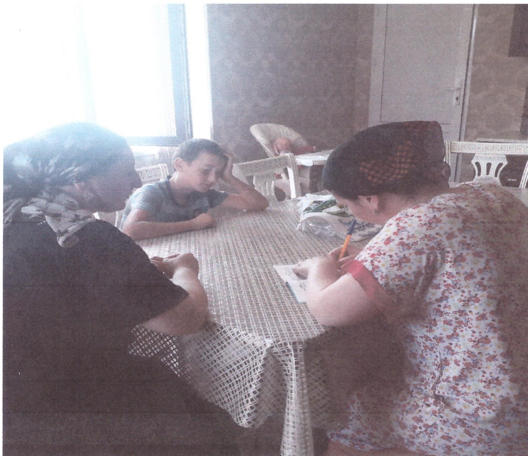
(посещение семьи учащихся с низкой мотивацией)

По итогам четверти с результатами индивидуальной работы ,учителям-предметникам рекомендована совместная работа со слабоуспевающими обучающимися.В течении года классные руководители,а также учителя-предметники информируют родителей об успеваемости обучающихся.